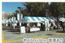
西武本川越ベベ 広場中央口(屋外)