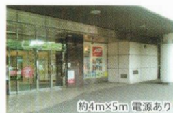
西武入間ベベ 南口前スペース(半屋外)