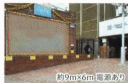
西武新宿ベベ 広場