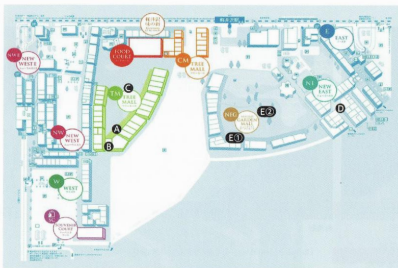
軽井沢ショッピングプラザ イベントスペース

※軽井沢ショッピングプラザイベントスペースは、バーゲンなどにより営業時間が変更となる場合があります。