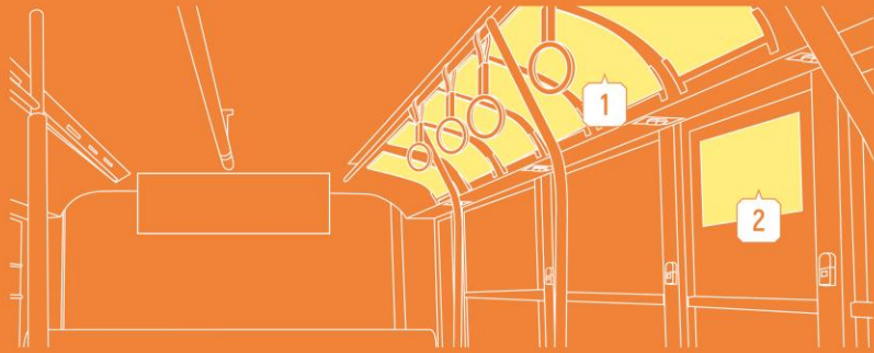
1 車内額面ポスター P.42 2 窓ステッカー P.42

日常生活で利用することの多い バスを使ったメディア展開で、習慣的に印象づけることができます。